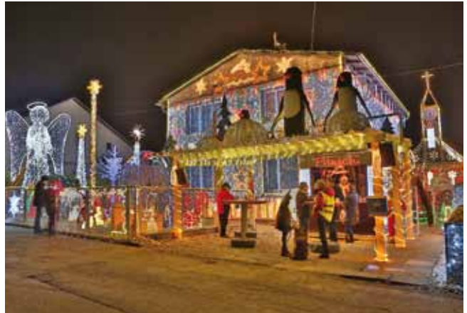
Das Weihnachts-Lichterhaus in Bad Hall ist bereits eine überregionale Attraktion.

Damit sorgen sie neben dem Staunen über den außergewöhnlichen Lichterglanz auch noch für Wärme in den Herzen bei jenen, die es nicht so gut haben.