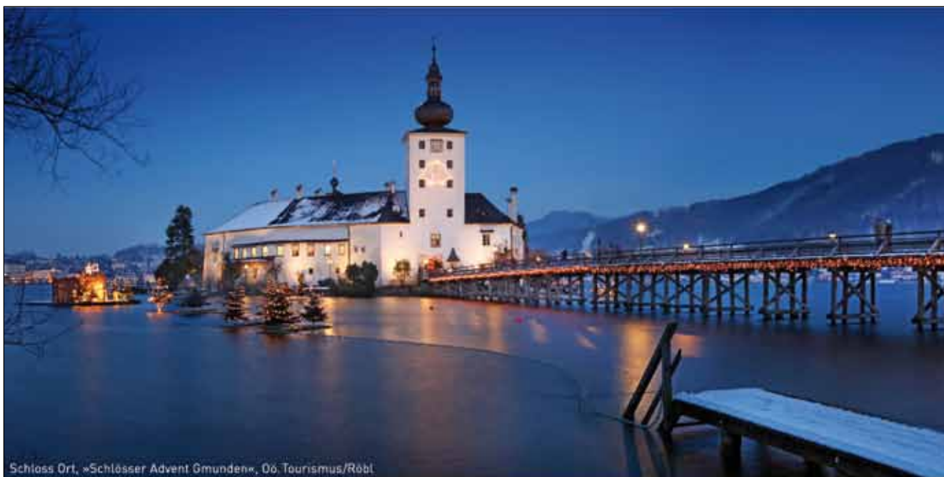
Schloss Ort, »Schlosser Advent Gmunden«, Oö. Tourismus/Röbl