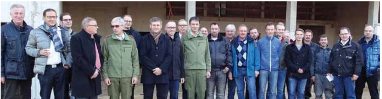
Die Teilnehmer an der Gleichfeier des Feuerwehr-, Musik- und Sänglerhauses.

Mitglieder des Gemeindevorstandes und Planungsausschusses vom bisherigen Baufortschritt überzeugen.